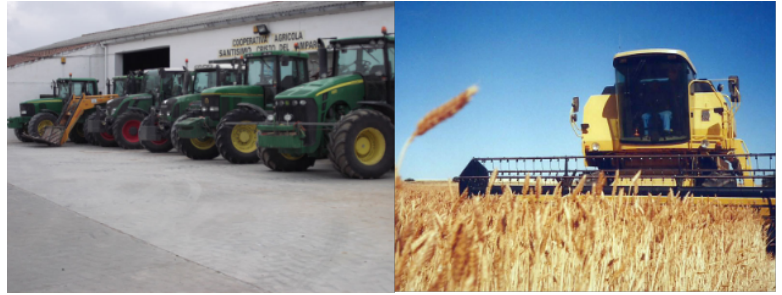
Figura 2: Imágenes de la flota de maquinaria que posee la Cooperativa Santísimo Cristo del Amparo de Saelices